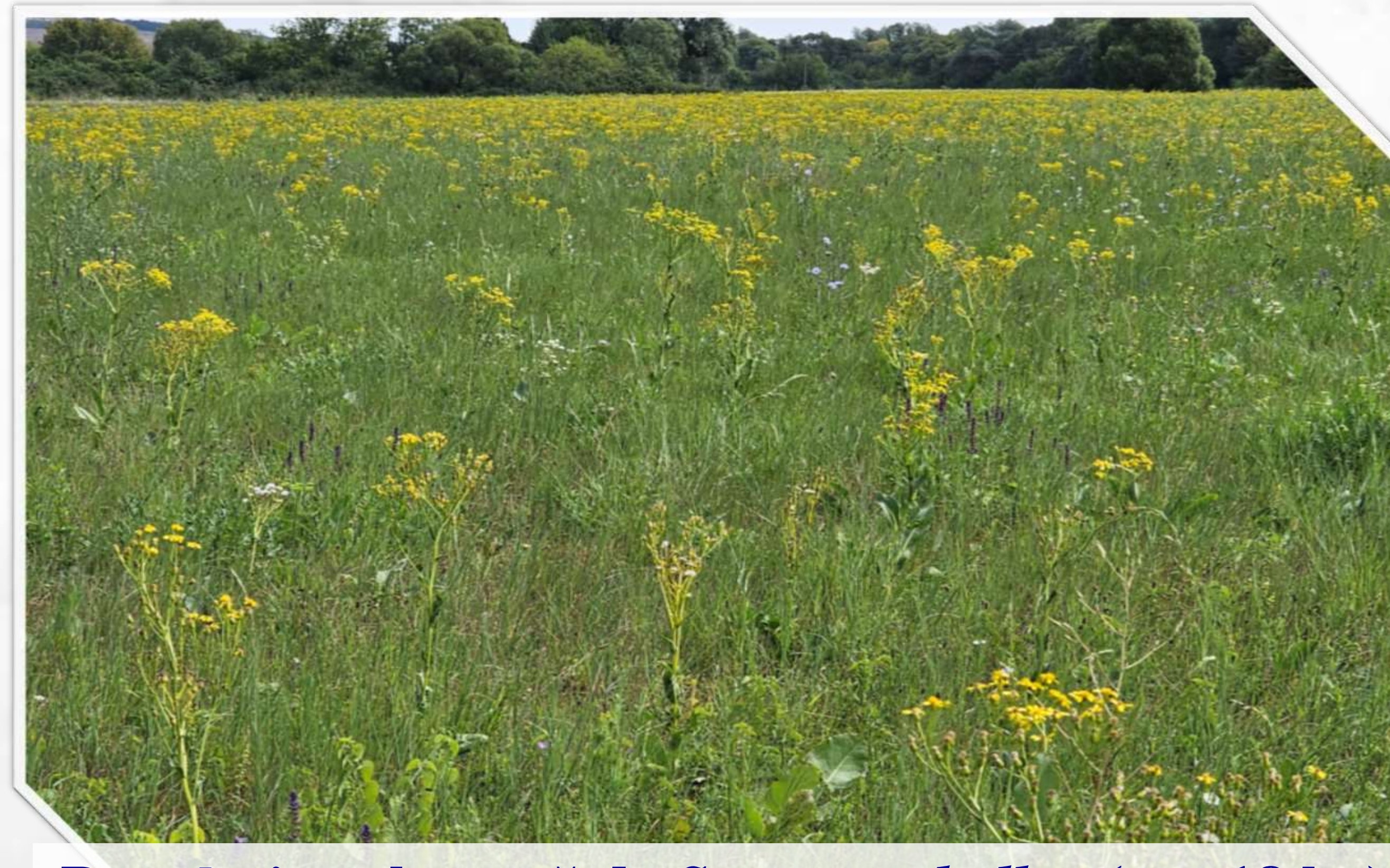
Populație valoroasă de S. macrophyllus (cca 18 ha)

Prezența unei populații valoroase de S. macrophyllus (probabil una dintre cele mai mari populații ale acestei specii pe teritoriul R. Moldova) într-un habitat de interes comunitar Natura 2000 sporește și mai mult valoarea conservativă a pajiștii din s. Neculăeuca și argumentează necesitatea instituirii unei noi arii naturale protejate și includerea acesteia în zona nucleu a Parcului Național Orhei.